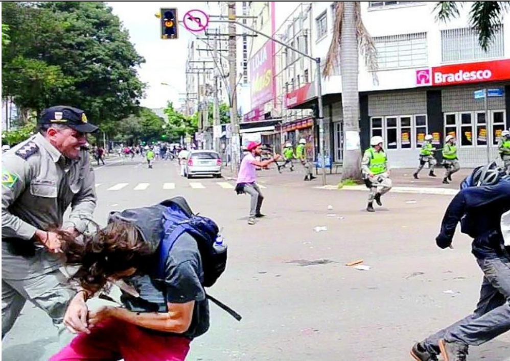
Imagem sem cortes veiculada no jornal O Popular.